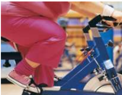
Figuur 4. De relatie tussen sport en gezondheid.

Wanneer binnen een gemeente een relatie is tussen sport en een ander beleidsveld, dan vinden de raadsleden dat ook belangrijk. Voor het integratiebeleid is die relatie bijna niet aanwezig, en de raadsleden vinden het ook niet zo belangrijk dat die relatie er komt. Hetzelfde geldt voor de relatie met wijkontwikkeling, alcoholbeleid en WMO. Dat er slechts in 34% van de gemeenten een relatie is tussen alcoholbeleid en sport, is opvallend. Veel gemeenten leggen in preventieprojecten namelijk wel de relatie tussen alcoholgebruik en de sportvereniging. Ook is er beperkt sprake van een relatie tussen de WMO en sport. De WMO is een belangrijk gemeentelijk instrument op het gebied van gezondheid en vrijwilligers, en de WMO strekt ook verder dan de zorg. Ook de sportvrijwilligers vallen onder de WMO.