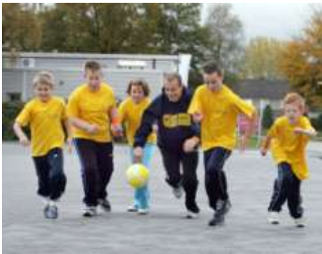
Figuur 5. Olympische Sporter als inspirator voor de jeugd.

Het Olympisch Plan 2028 is voor veel raadsleden nog onbekend. In dit onderzoek geeft 88% aan niet te weten welke rol het Olympisch Plan 2028 in hun gemeente kan spelen. Het Olympisch Plan heeft drie belangrijke tijdsmarkeringen: 2016, waarin Nederland op Olympisch Niveau moet zijn; 2021 waarin Nederland een eventueel bid voor 2028 moet uitbrengen; en natuurlijk 2028 waarin Nederland eventueel de Olympische Spelen wil organiseren.