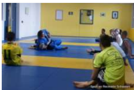
Figuur 1. Samenwerking tussen sport en onderwijs (Schiedam)

In het volgende hoofdstuk staat de onderzoeksmethode beschreven. Daarna volgen de resultaten en conclusies met aanbevelingen.